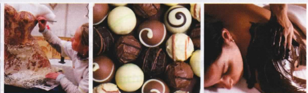
Für jeden Geschmack: Das Tübinger Schokoladenfestival chocolART

Weltweit einzigartig ist das Konzept der BIO-Milch: Die Trinkschokoladen der Chocolatiers werden mit Milch bester BIO-Qualität zubereitet, die zudem Produkt regionaler Kreisläufe ist. Nachhaltige Ökologie und lokale Wirtschaft treffen sich bei bestem Geschmack.